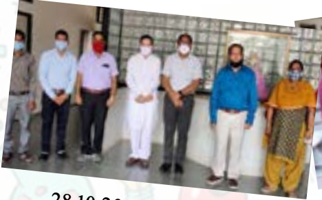
28.10.20 Government B.Ed. College, Nasvadi