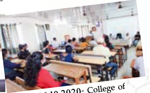
26.10.2020- College of Education, Nani Daman