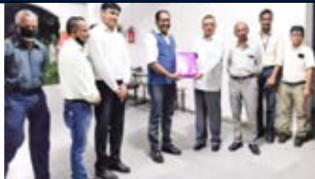
27.10.2020 - College of Education Kharod