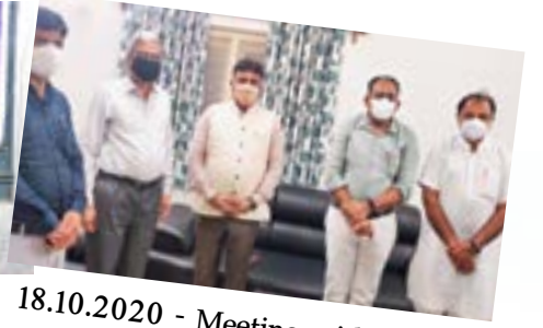
18.10.2020 - Meeting with Hon. V.C. Sanskrit University, Somnath