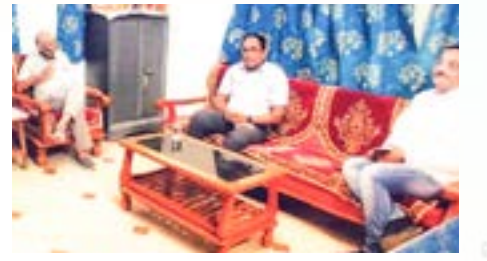
28.10.20 Sheth M N C College of Education, Dabhoi