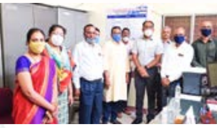
28.10.20. Shree Sarvajanic Education College, Godhara