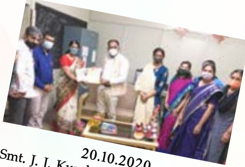
20.10.2020 Smt. J. J. Kundalia Graduate Teachers College, Rajkot