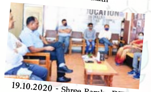
19.10.2020 - Shree Ramba DIET Porbandar