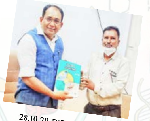
28.10.20 DIET, Bharuch

પ્રાદેશિક ભાષા, સ્થાનિક જીવનશૈલીને વણી લેતી શિક્ષણ પ્રક્રિયા તૈયાર કરવી જરૂરી છે. એટલું જ નહીં માન. વડા પ્રધાનશ્રી નરેન્દ્ર મોદીએ જણાવ્યું છે કે “આ શિક્ષણ નીતિ સફળતા તેની સાથે જોડાયેલાં તમામ વર્ગોની સહભાગીતા પર આધારિત છે.” આ વાતને અમે ધ્યાનમાં રાખી છે અને શિક્ષકો તૈયાર કરતી યુનિવર્સિટી તરીકે અમારા તાલીમાર્થીઓ નીતિને અસરકારક બનાવવાનું માધ્યમ બને તે પ્રકારે તેમની તાલીમ સુનિશ્ચિત કરવાની છે.”