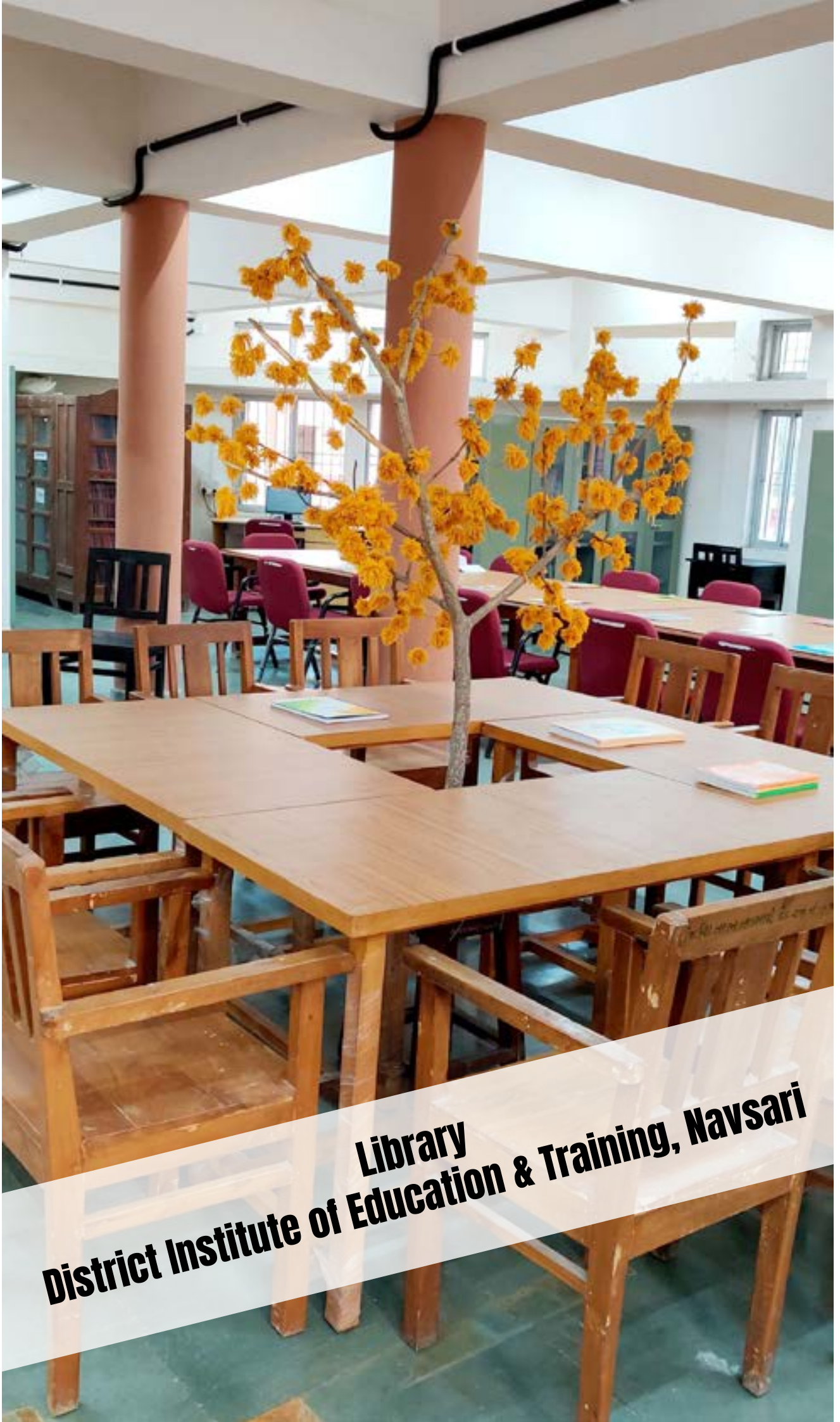
Library District Institute of Education & Training, Navsari