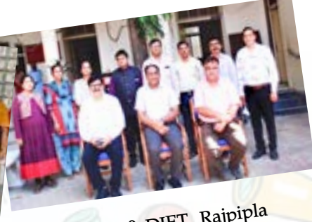
28.10.20 DIET, Rajpipla