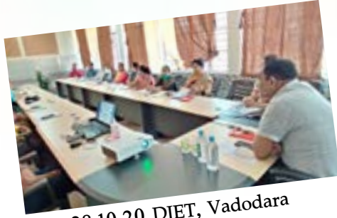
28.10.20 DIET, Vadodara