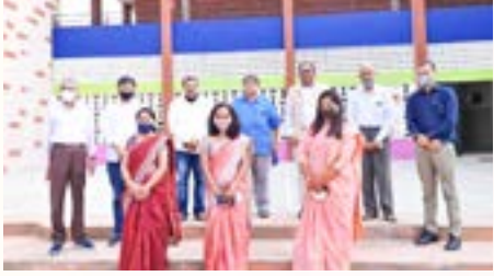
20.10.2020 - Institute of Language Teaching, Rajkot